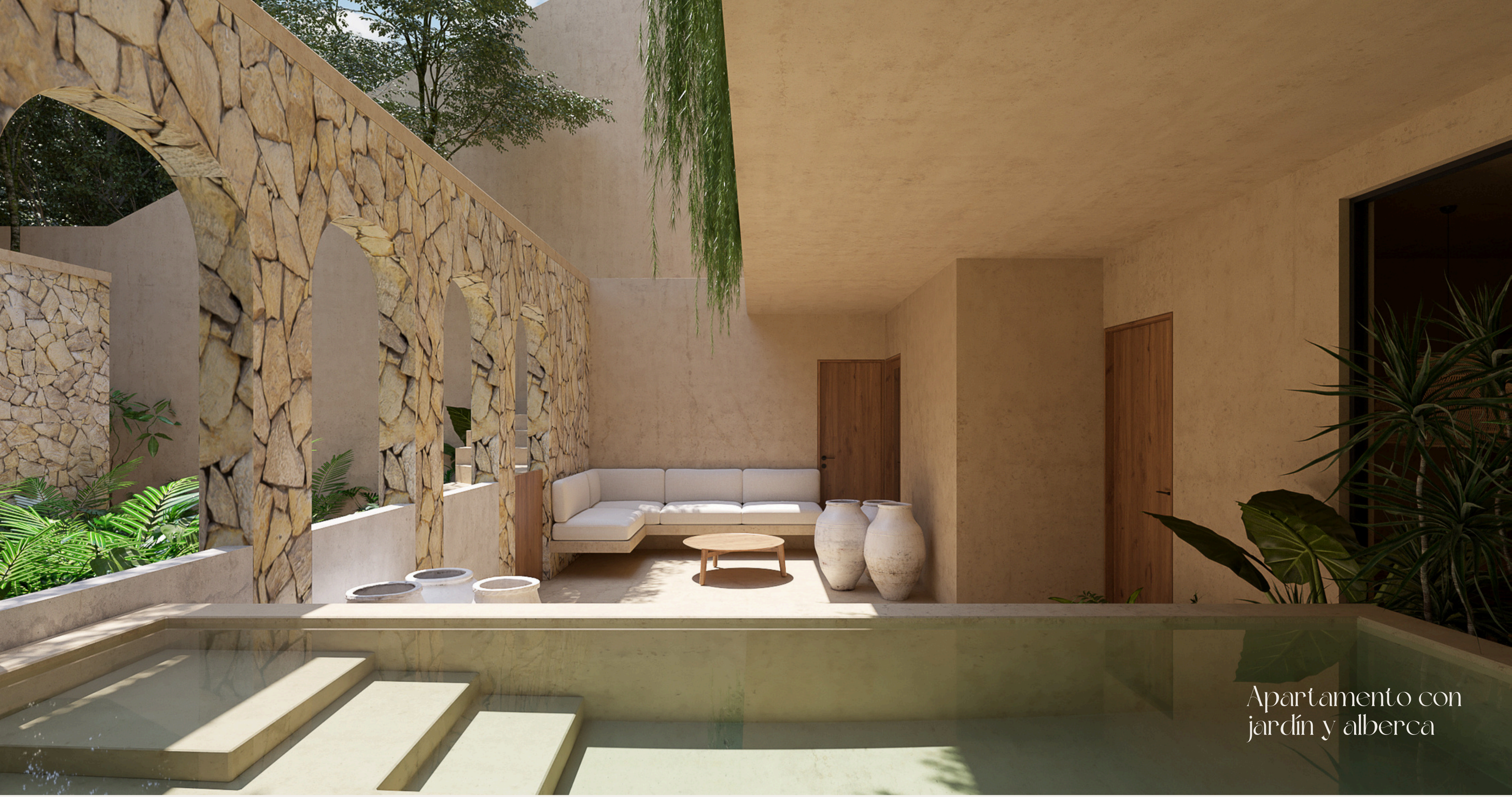
Apartamento con jardín y alberca